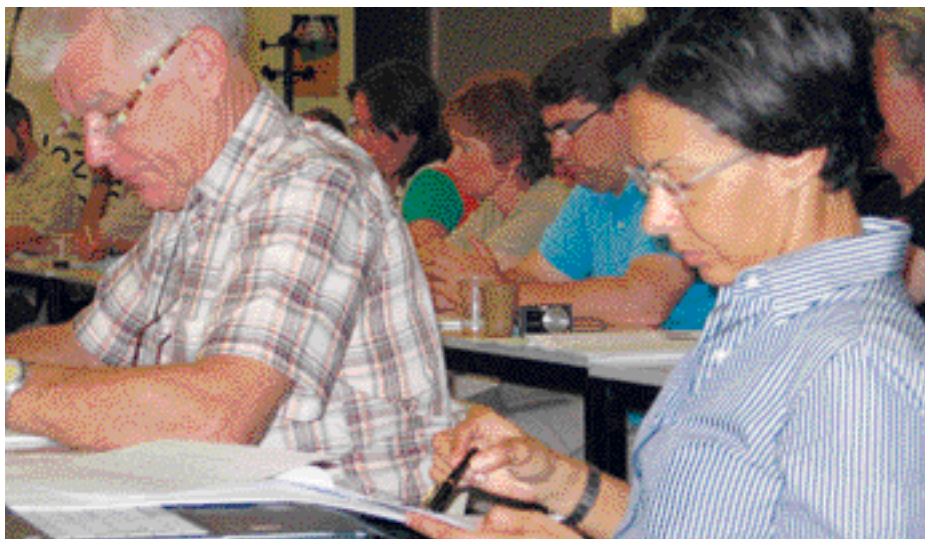
Conseil national du SNUEP-FSU des 30 juin et 1er juillet 2009

Pour la défense des personnels, votez et faites voter pour les listes SNUEP-FSU aux élections au conseil d'administration.